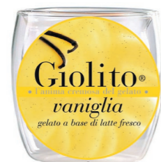
Vaniglia – Rum