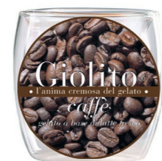
Caffè – Baileys