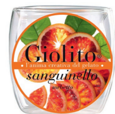
Arancia – Campari