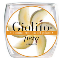
Pera – Poire Williams