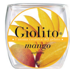
Mango – Limoncello