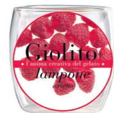
Lampone – Prosecco