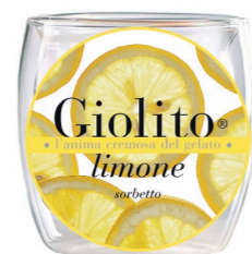
Limone – Vodka