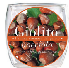
Nocciola – Sammarzano Borsci